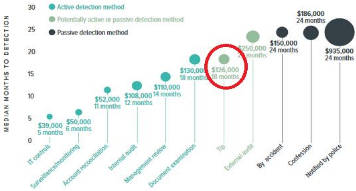
FIG. 11 How does detection method relate to fraud duration and loss?